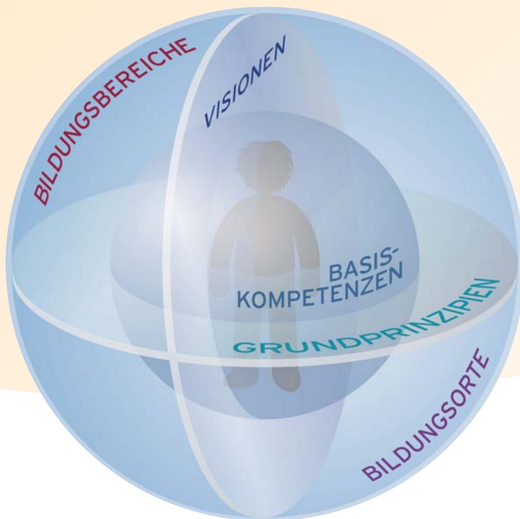
Die Struktur des Bildungs- und Erziehungsplans von 0 bis 10 Jahren in Hessen

plans für die Altersgruppe von 0 bis 3 Jahren vorzunehmen und zu verdeutlichen, welches Potenzial der Plan für diese Kinder bieten kann: Wie sind die Grundsätze und Prinzipien des Plans bei der Bildung der Jüngsten zu verstehen? Welche Kompetenzen sind es, die vor allem in den ersten Lebensjahren von besonderer Bedeutung sind und wie lassen sich diese im Sinne der Philosophie des Plans stärken? Die Handreichung hat es sich zum Ziel gesetzt, die Relevanz des Hessischen Bildungs- und Erziehungsplans für die unter Dreijährigen zu verdeutlichen und alle „Ko-Konstrukteure“ frühkindlicher Bildung zu einer gemeinsamen Bildungsphilosophie von Anfang an einzuladen.